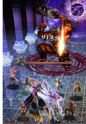
白熱のレイドバトル